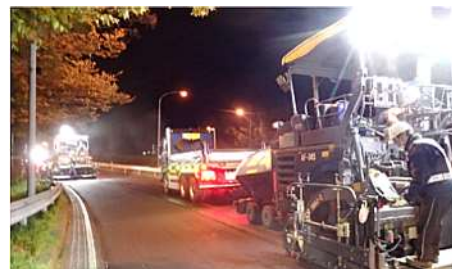
舗装補修工事 作業状況