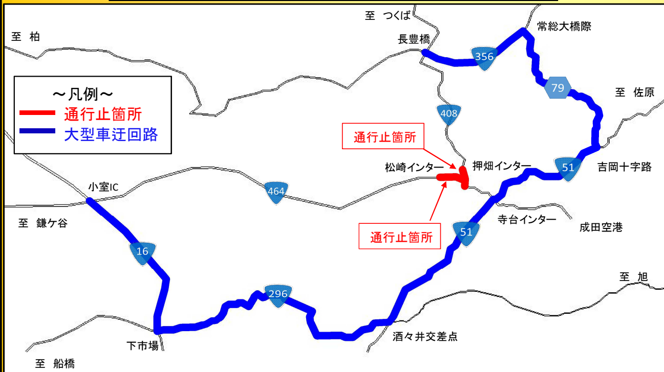
大型車(車両総重量11t以上)迂回路案内図