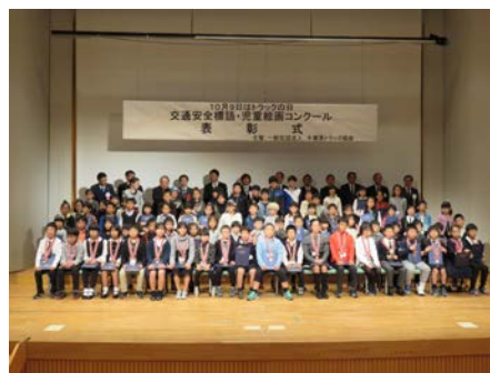
表彰者記念撮影 (入賞者のみ)