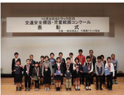
表彰者記念撮影 (全員)