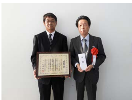
交通遺児等育成基金へ寄託