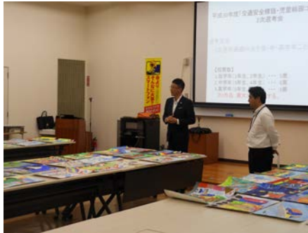
古川実行委員長挨拶