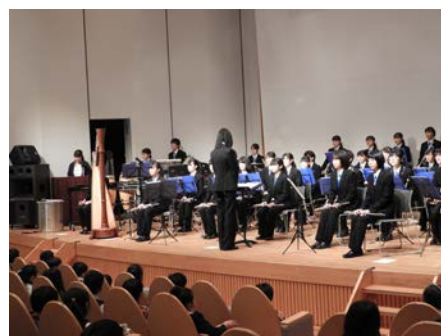
千葉商業高等学校 吹奏楽部