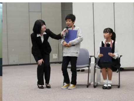
千葉県知事賞インタビュー