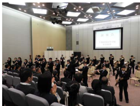
千葉商業吹奏楽部