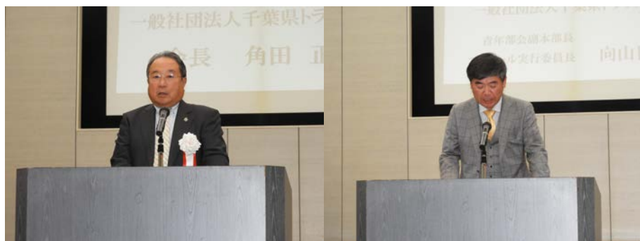
主催者挨拶(角田会長)

青年部会では、今後も諸行事・研修会等を計画・実行して参りますので、皆様のご指導ご鞭撻をお願い申し上げます。