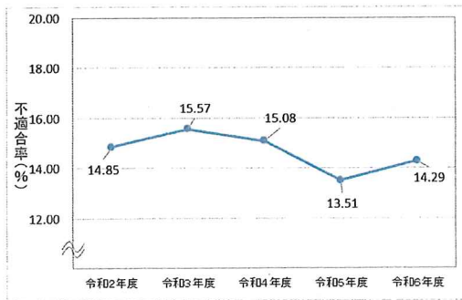
不適合率の推移 (最近5年間)